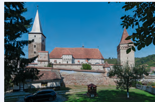
Meschen. Südsicht der Kirchenburg