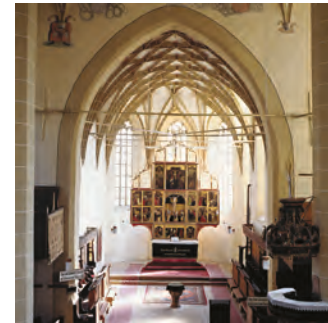
Birthälm. Innenansicht zum Altar