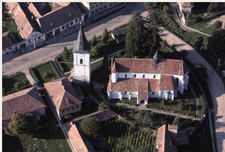
Reichesdorf. Flugaufnahme der Kirchenburg

Der Bildband Mediasch und das siebenbürgische Weinland steht in einer Reihe mit den Bänden „Siebenbürgen im Flug“, „Das Burzenland“, „Hermannstadt und das Alte Land“, „Das Repser und das Fogarascher Land“ und „Einblicke ins Zwischenkokelegebiet“, „Schäßburg und die Große Kokele“. Der Bildband wird zum Heimattag 2022 erscheinen.