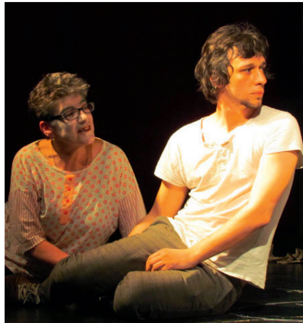
Duo Bastet