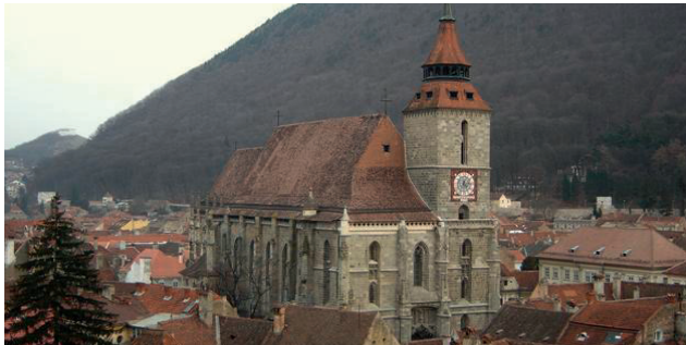
Schwarze Kirche in Kronstadt / Braşov

VG 137 Mi, 18. November Ioan Lăzărescu Die rumänische Variante der deutschen Hochsprache