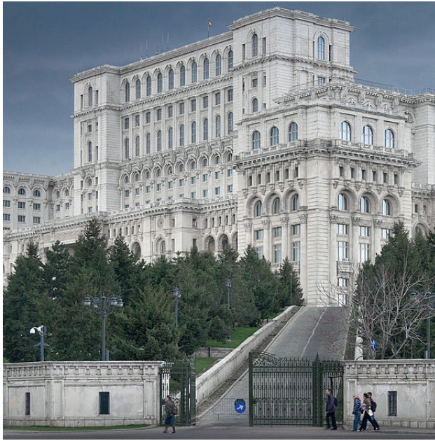
Palast des Parlaments in Bukarest

Oberes Foyer Zentral- bibliothek Di, 17. November Hermann Scheuringer Das Deutsche und die Deutschen in Rumänien - Geschichte, Gegenwart, Zukunft