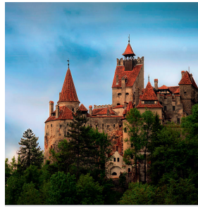
Die Törzburg / Schloss Bran in der Nähe von Kronstadt / Braşov