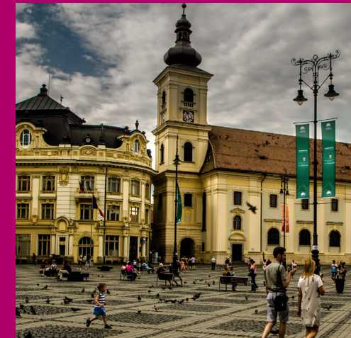
Großer Ring / Piaţa Mare in Hermannstadt / Sibiu