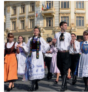
Siebenbürger Sachsen in Tracht