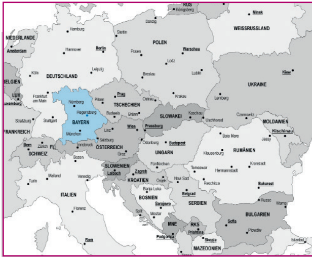
Forschungsschwerpunkt des Fz DiMOS: Mittel-, Ost- und Südosteuropa