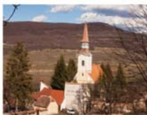
Deutsch-Kreuz / Criț