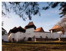
Deutsch-Weißkirch / Viscri