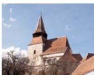
Radeln / Rodeș