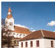
Bodendorf / Bunești