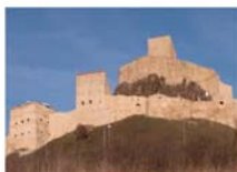
Reps / Rupea