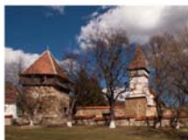
Meschendorf / Meșendorf